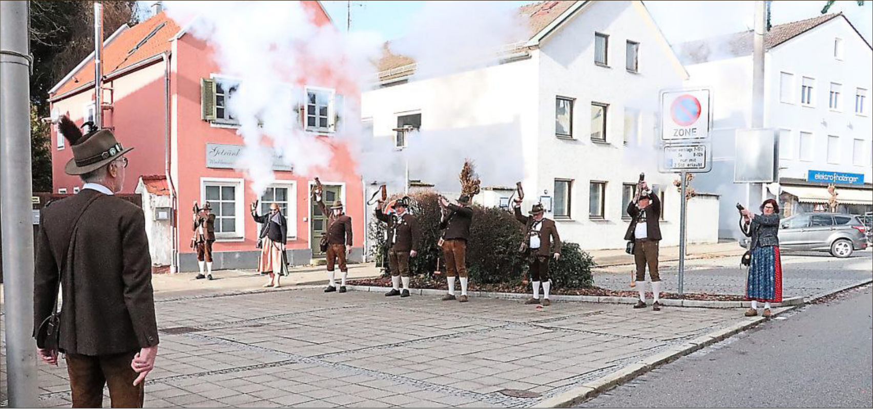
Mit drei Salutschüssen wurde das neue Jahr von den Bogener Böllerschützen begrüßt.