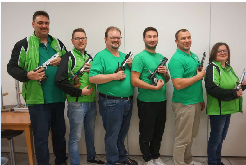
LP 1 in der Gauoberliga