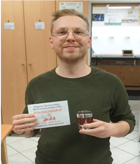
1. Platz Felix Weber 11,6 Teiler