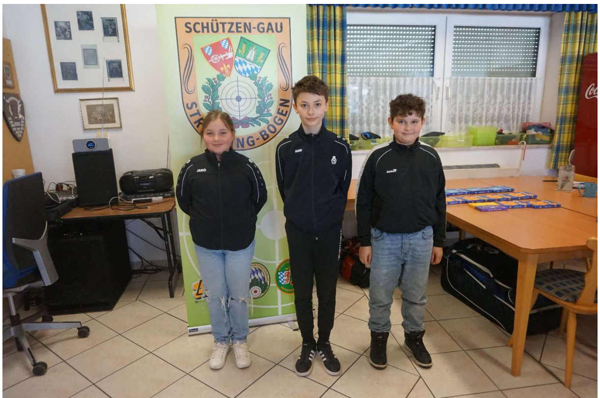
5. Platz Perlbachtaler Oberzeitldorn