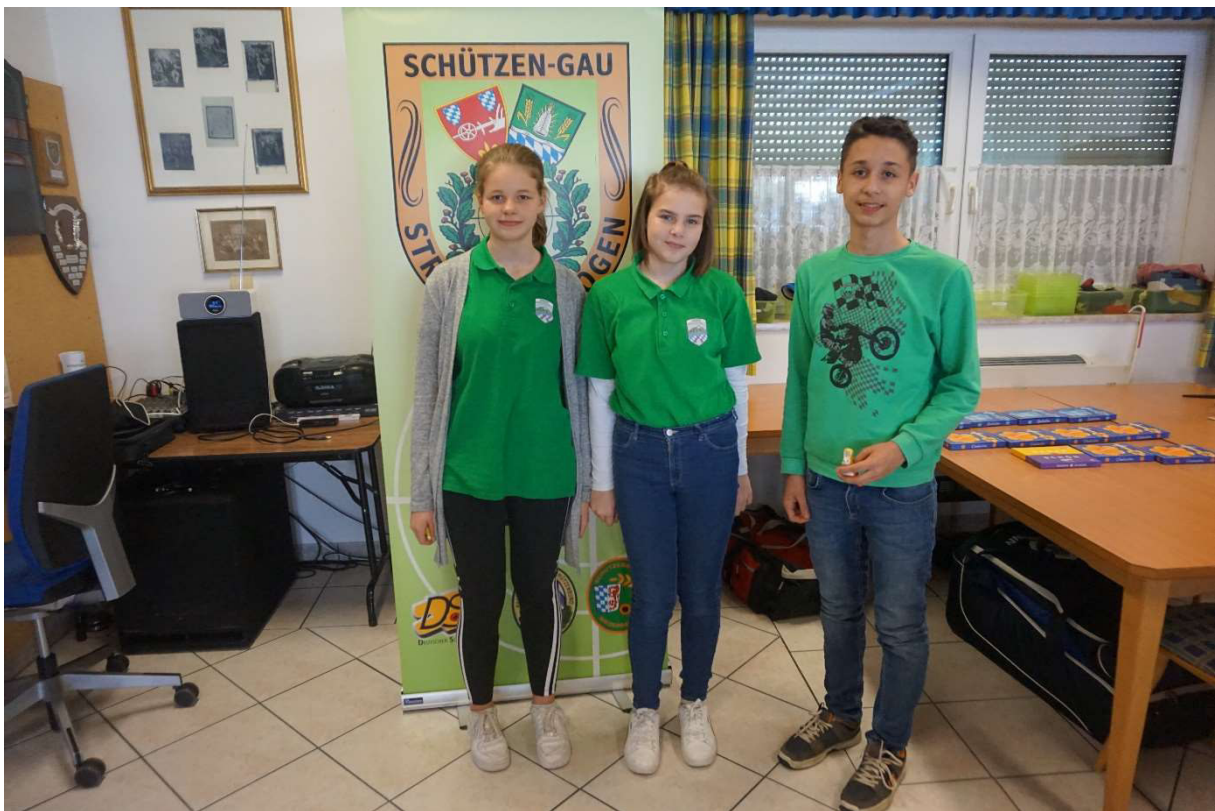
3. Platz Bogener Sportschützen 1