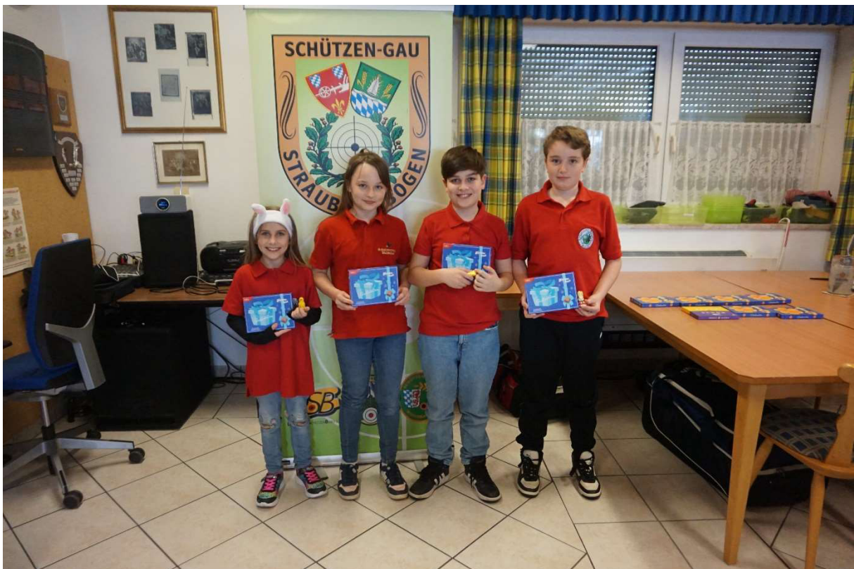
1. Platz Waldeslust Kichroth 1