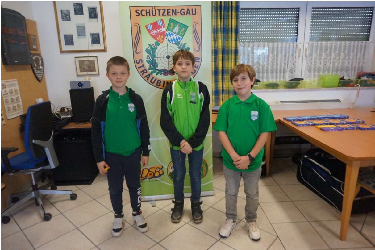
2. Platz Bogener Sportschützen 2