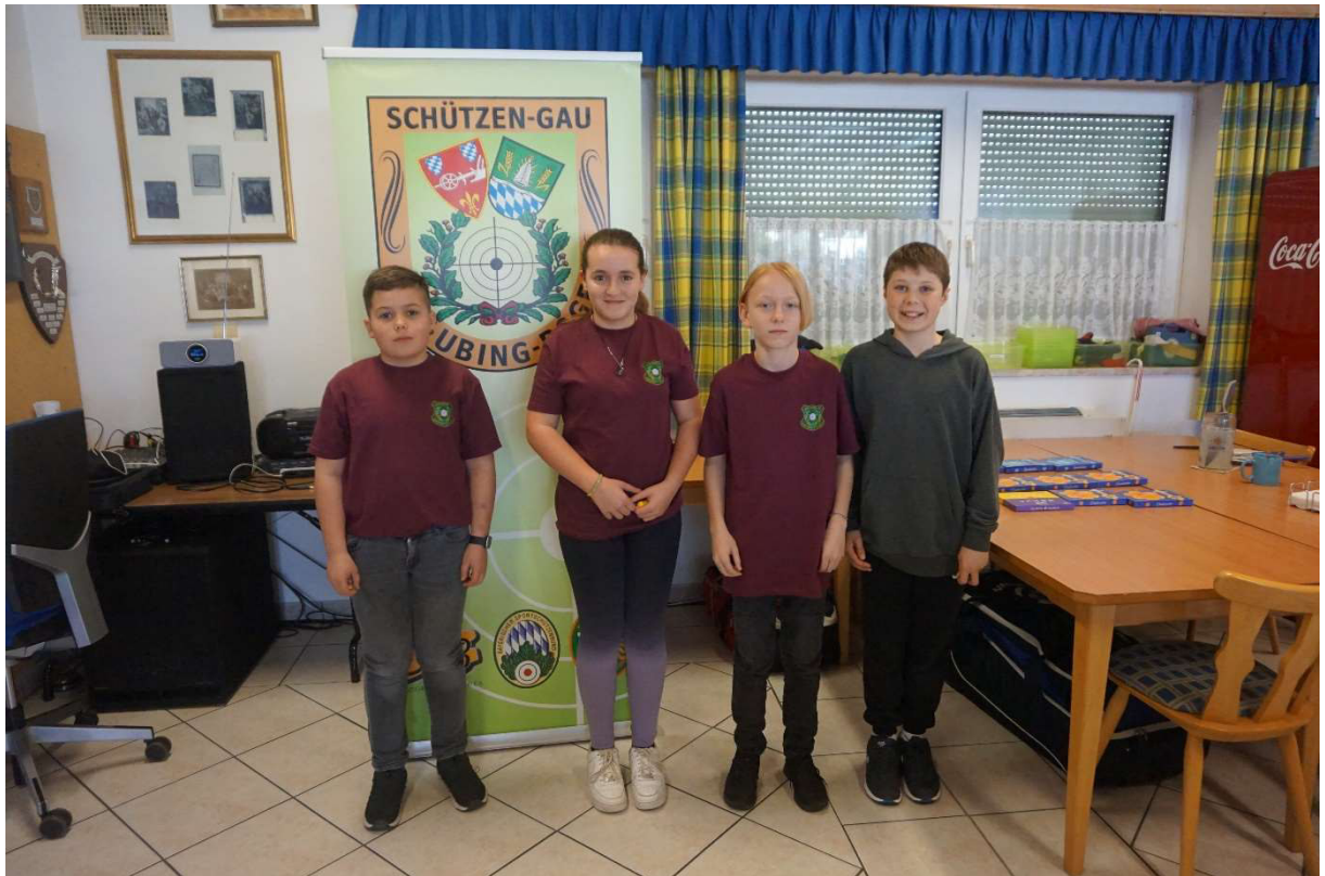
4. Platz Eintracht Obermiethnach