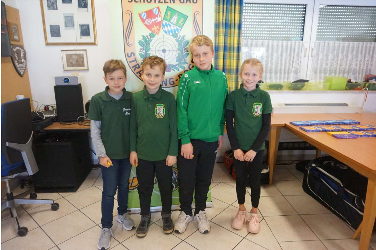
6. Platz Jagabluat Motzing